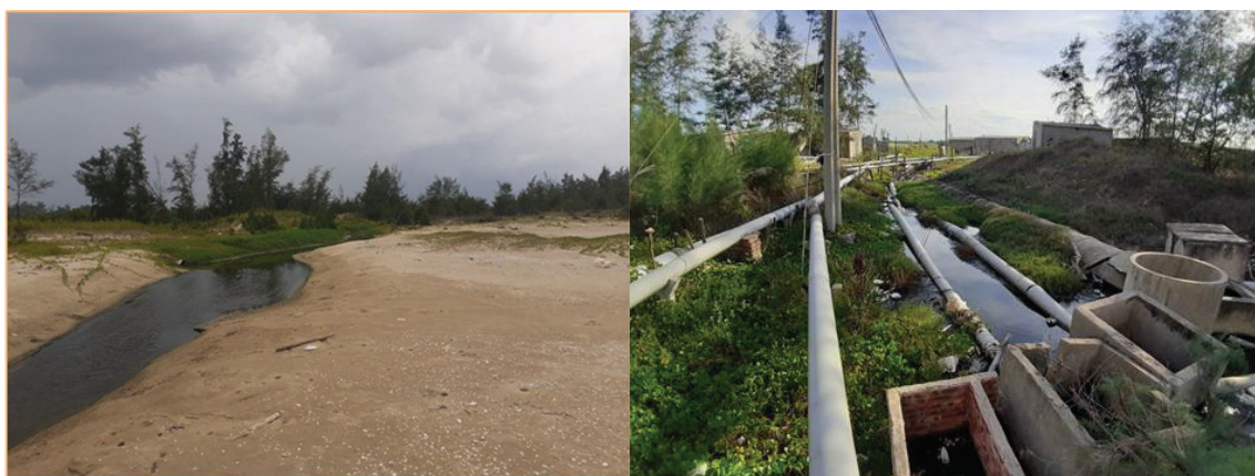
Hình 2: Hình thức thải nước trong ao nuôi tôm trên cát ra biển (A: bằng đường mương, B: bằng đường ống)

hoạch và trong quá trình nuôi. Nước trong ao nuôi tôm được xả thải trực tiếp ra biển bằng đường ống hoặc kênh/mương thoát. Do lượng bùn, mùn bã hữu cơ sau mỗi vụ nuôi tồn dư lớn, đồng thời không được xử lý trước khi thải ra nên màu nước nơi được xả thải luôn có màu đen và mùi hôi nồng (Hình 2). Một số nghiên cứu đã chỉ ra ước tính có khoảng 1,5-2 tấn bùn thải/ha/vụ nuôi tôm, bùn thải bao gồm vỏ tôm lột, thức ăn thừa, phân tôm, xác tảo chết, các hóa chất xử lý ao nuôi như vôi, thuốc tím, chlorine, kháng sinh tan trong nước, tích tụ dưới đáy ao [1], [2]. Thực trạng cho thấy lượng chất thải này không được xử lý mà được xả thải đi vào hệ sinh thái sẽ ảnh hưởng nghiêm trọng đến hệ động thực vật, gây mất cân bằng sinh thái và suy thoái khu sinh thái vùng ven biển thậm chí có thể ảnh hưởng đến quá trình sinh trưởng và phát triển của nguồn lợi hải sản tự nhiên. Bên cạnh đó, nguồn nước bùn thải còn gây ô nhiễm và mặn hoá nguồn nước ngầm thông qua việc xả thải bằng đường mương hay hệ thống ống kém chất lượng (vỡ, rò rỉ). Dịch bệnh có thể lây lan sang các đầm nuôi khác do sử dụng nước ngầm đã bị nhiễm bệnh, tạo cơ hội bùng phát dịch bệnh, ảnh hưởng trực tiếp đến sản xuất trước mắt và lâu dài.