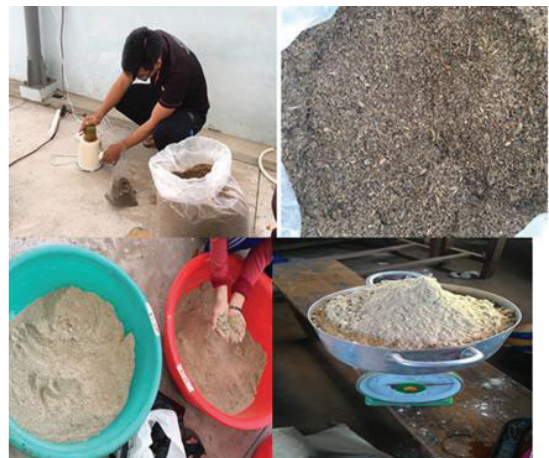
Hình 2. Phối trộn nguyên liệu thức ăn