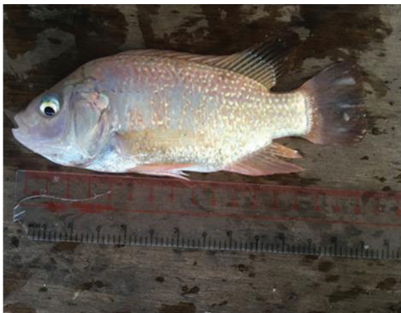
Hình 1. Đo chiều dài cá

Đề tài được thực hiện tại Trại thực nghiệm