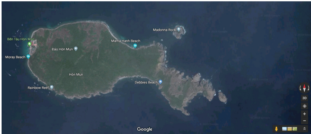
Hình 1. Bản đồ khu vực nghiên cứu